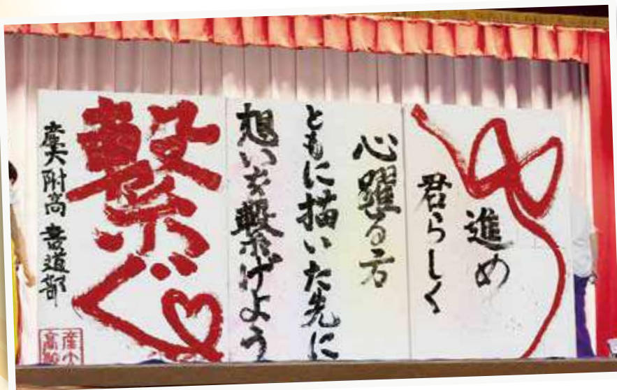
書道部による会報題字「くろがね」

このほか、書道部は「第59回高野山競書大会」において、特別賞に入賞いたしました。